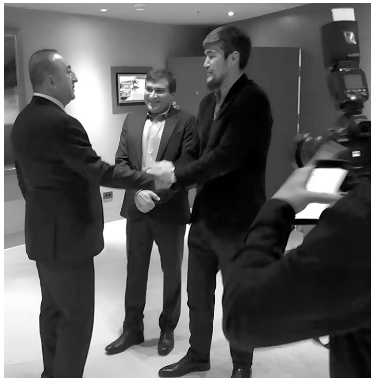
Арман Джумагельдиев (Арман Дикий) встречается с министром иностранных дел Турции Мевлютом Чавушоглу

Исторически через Казахстан проходили линии электропередач из уральского региона в Сибирь, транспортные магистрали в Китай (примерно на 1000 км более короткий путь, чем в обход Казахстана), а протяжённые границы между Россией и Казахстаном — почти 7,6 тыся-