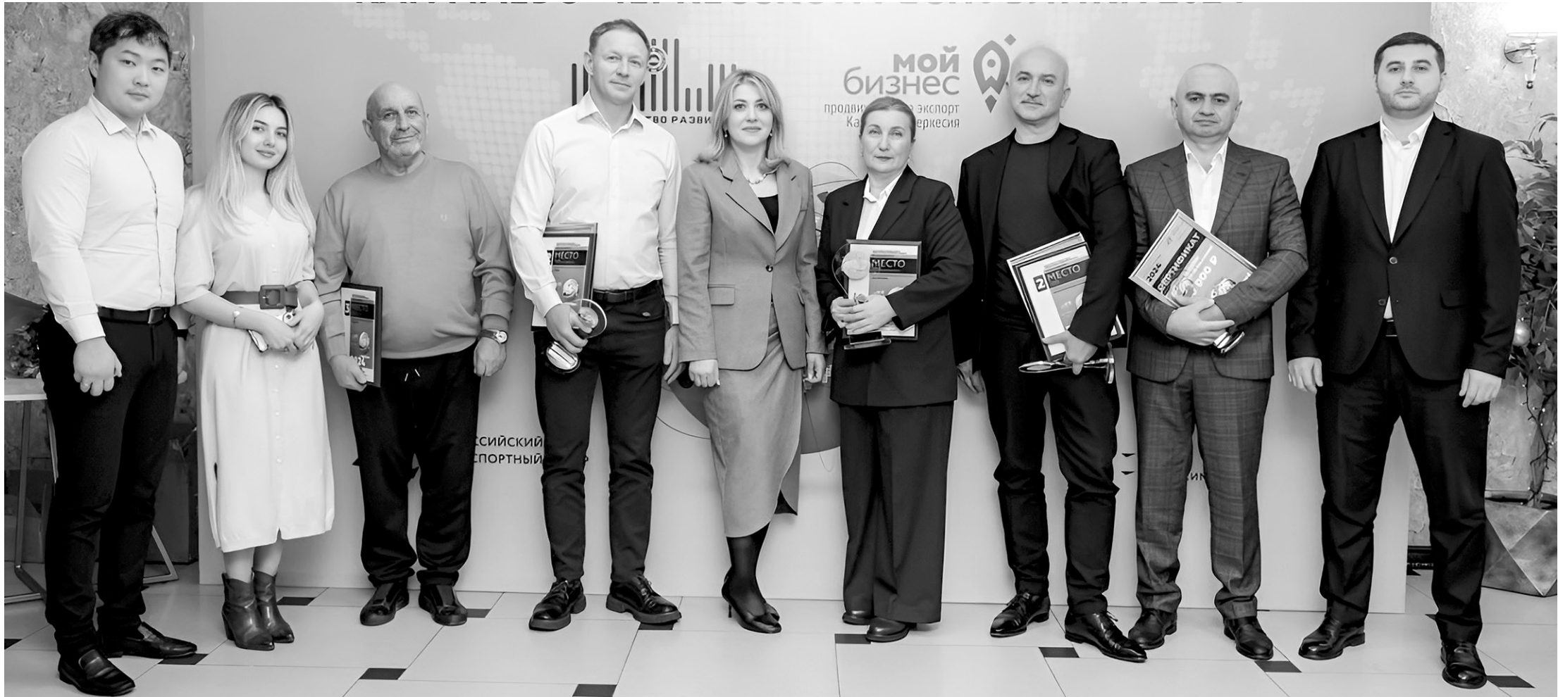
Победители и призёры регионального конкурса «Экспортёр года — 2024»

Наградили победителей и призёров конкурса «Экспортёр года»