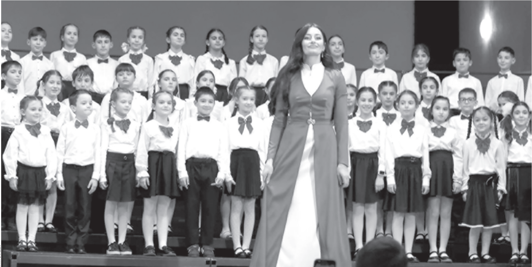
Выступление на фестивале одного из детских хоров республики