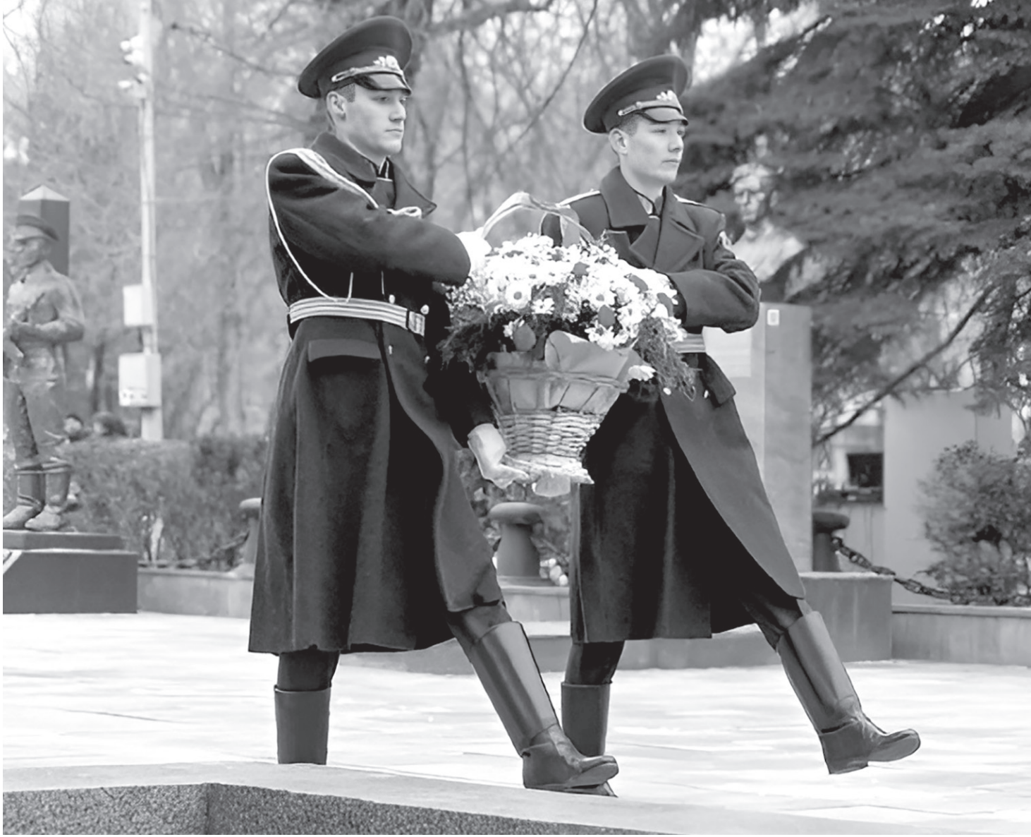
Возложение цветов к памятнику павшим героям

В день 83-й годовщины освобождения Черкесска состоялся