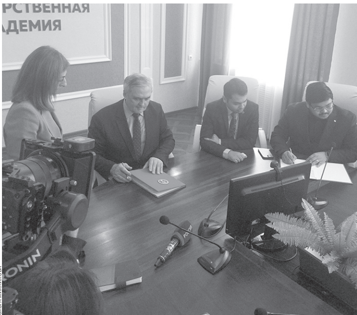
Подписание соглашения между СКГА и рекрутинговой компанией «STUDY PALACE HUB PVT LTD»

Сегодня в Северо-Кавказской государственной академии обу-