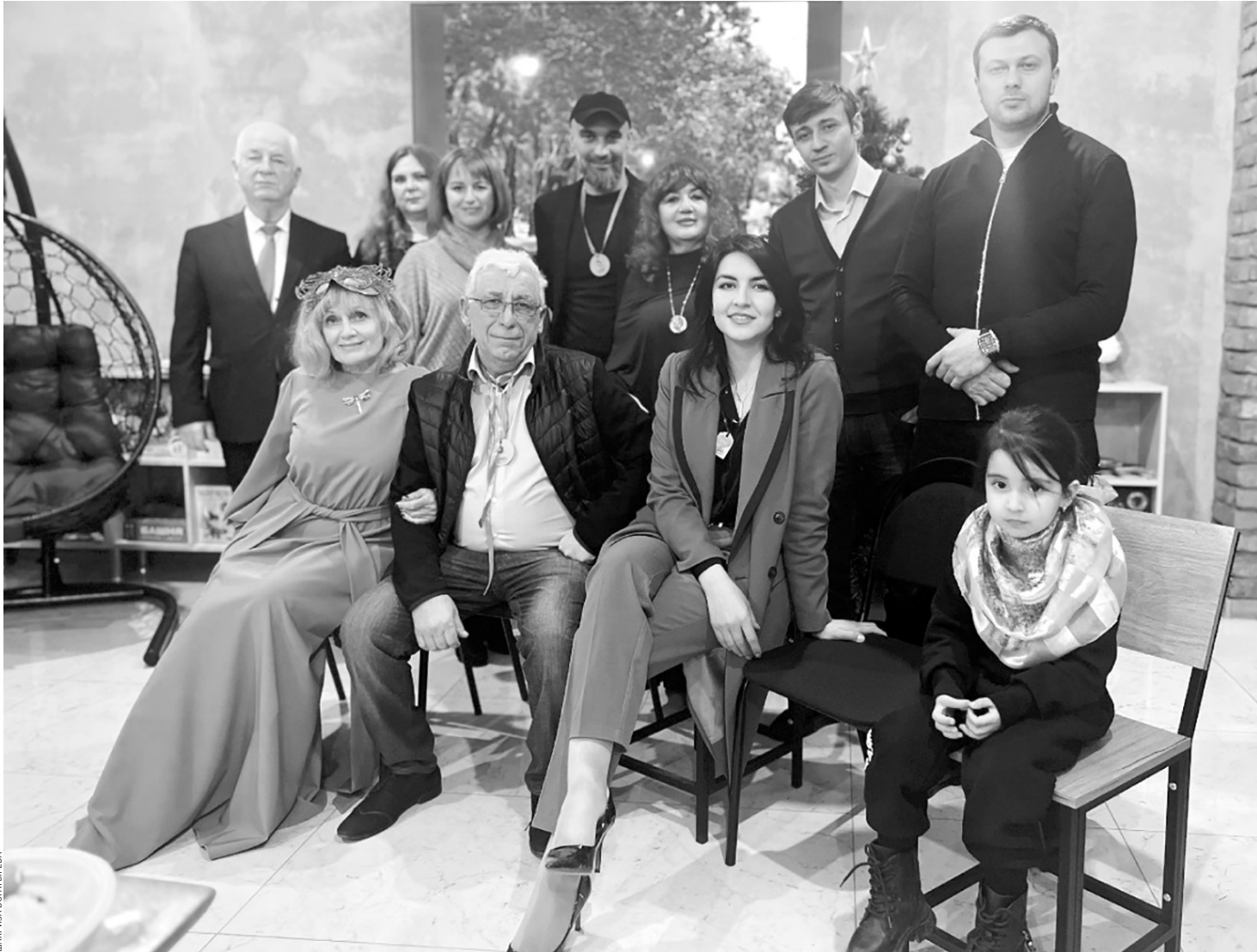
Новый год в «Сиреневом салоне»

Но помимо привлечения сотен авторов конкурсы: зимнего стихотворения «Три белых коня»; гражданской лирики «Будь горд, потомок вольного народа!»; «Стоит в поле Теремок»; в честь 10-летия республиканского детского журнала «Наш теремок», выпускаемого редакцией газеты «День республики»; пейзажной лирики «Горы, что вы сделали со мною» и